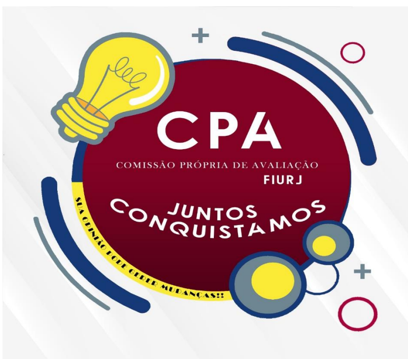
Figura 2: Selo CPA Juntos Conquistamos.

A criação do selo CPA – JUNTOS CONQUISTAMOS, fomenta o engajamento crescente da comunidade acadêmica em ser ativa no processo de avaliação institucional e conseqüente aperfeiçoamento provenientes das percepções obtidas.