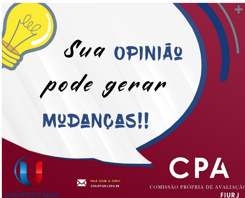
Figura 1: Banner sensibilização CPA

Após a tabulação, a CPA confeccionará um relatório sintético anual, englobando os 05 (cinco) eixos, apresentando a Mantenedora e Direção Acadêmica os resultados, a fim de subsidiar o planejamento institucional.