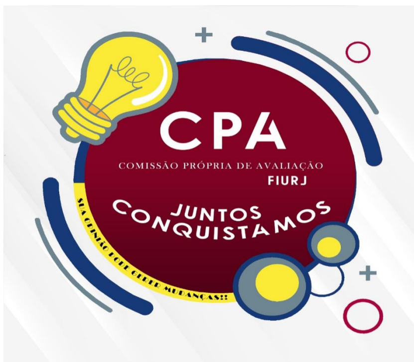
Figura 2: Selo CPA Juntos Conquistamos.

A criação do selo CPA – JUNTOS CONQUISTAMOS, fomenta o engajamento crescente da comunidade acadêmica em ser ativa no processo de avaliação institucional e consequente aperfeiçoamento provenientes das percepções obtidas.